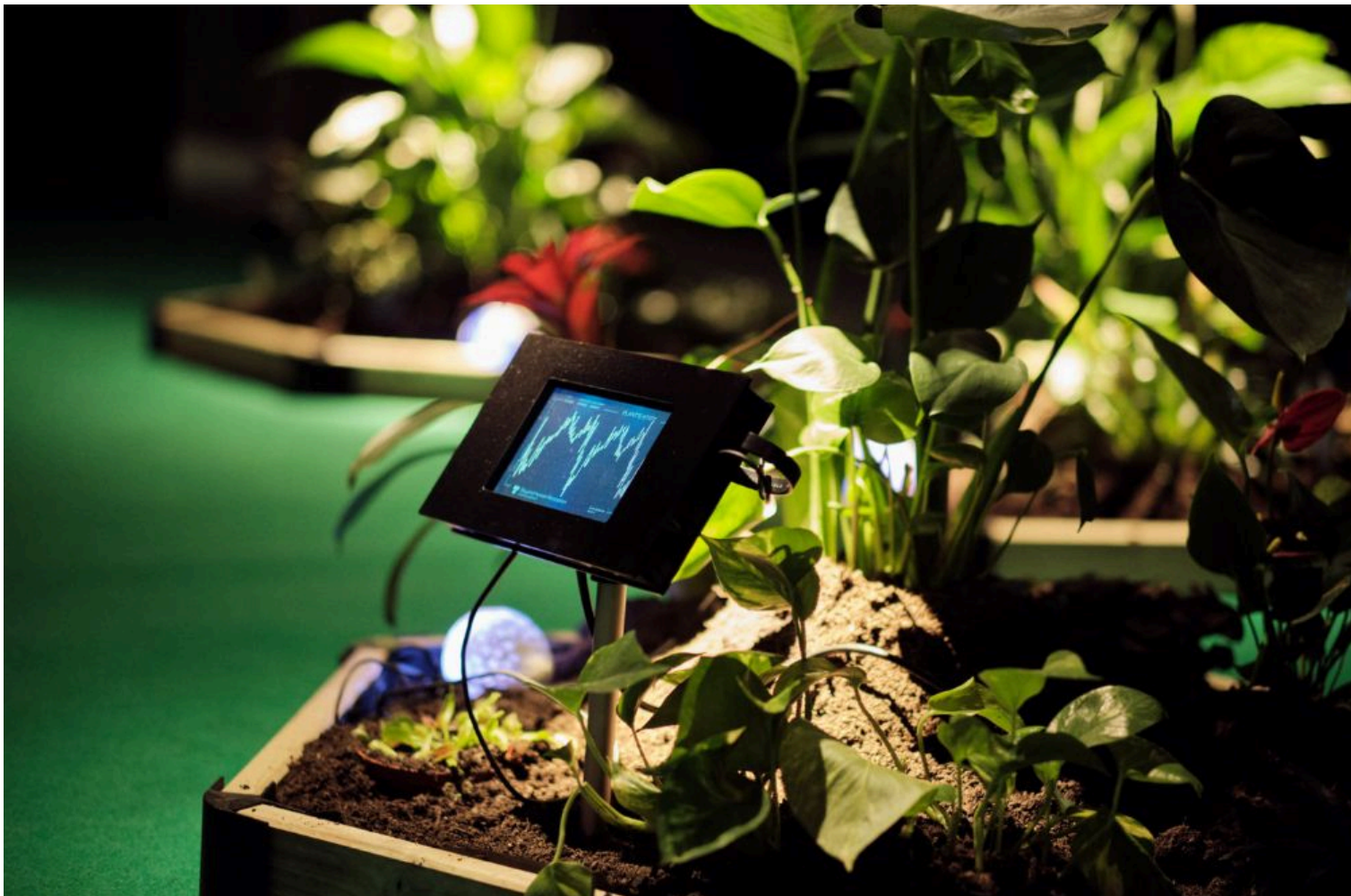
uh513, Beyond Human Perception